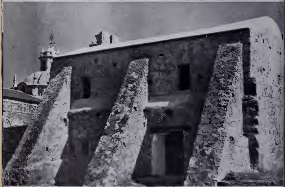
Fiba: La parte más antigua de J. María (1638) corredor con viguería de algarrobo. Lado O. 2.º piso: Contrafuertes en el lado Este.